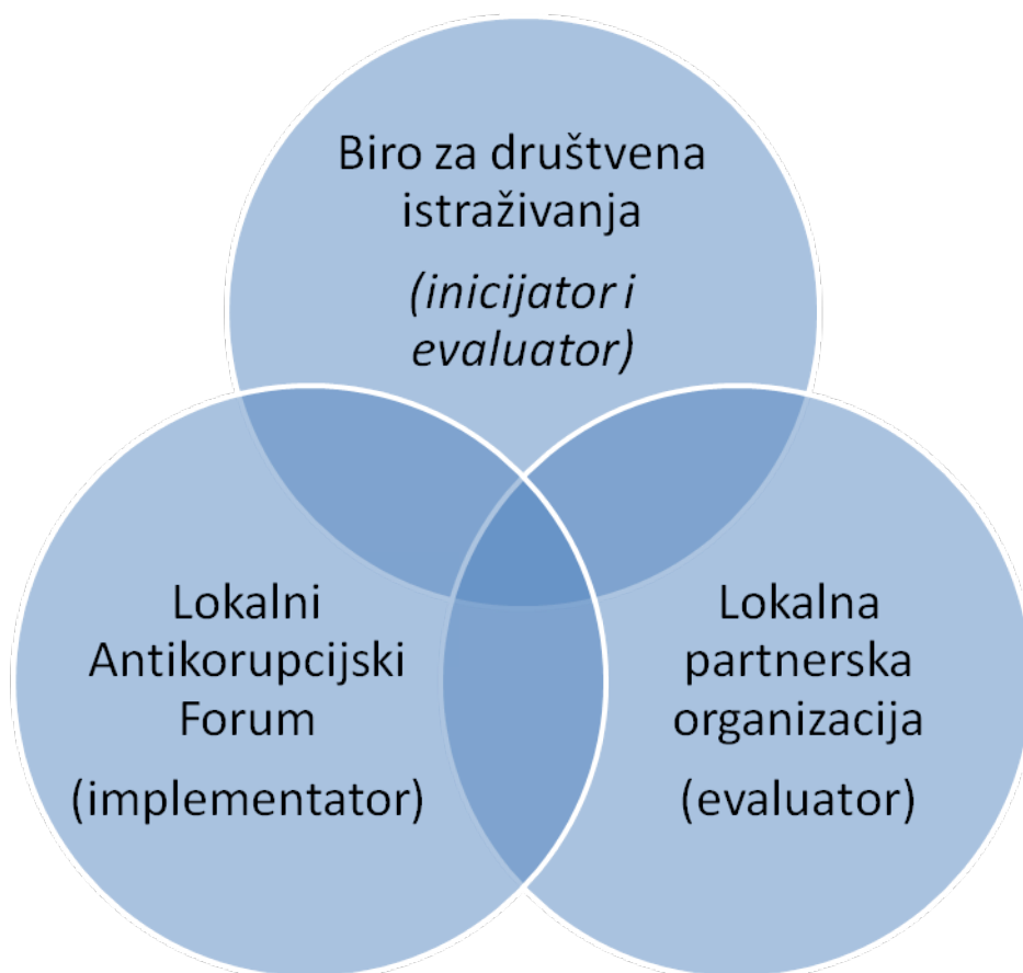
Shema 1. Akteri u procesu kreiranja, realizacije, monitoringa i evaluacije Lokalnog plana za borbu protiv korupcije